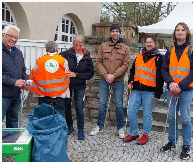
Aktionsgruppe „Sauberes Aschersleben“