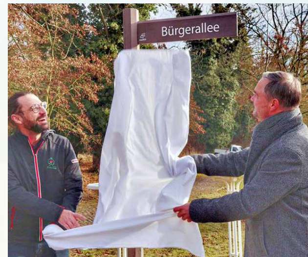
Eröffnung Bürgerallee auf dem Friedhof