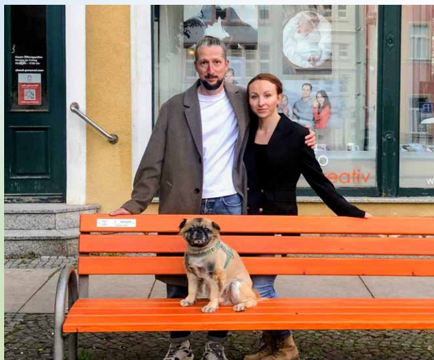
Projekt „Meine Bank für Aschersleben“