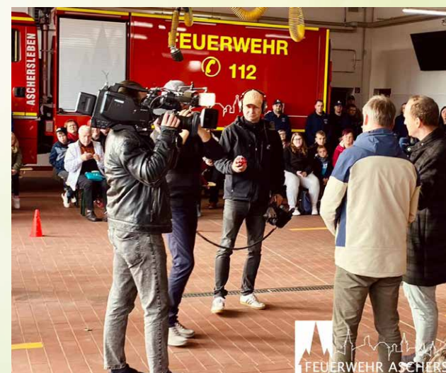
„Mach dich ran“ in Aschersleben