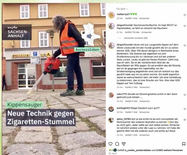
Kippensauger MDR Insta 380.000 Aufrufe