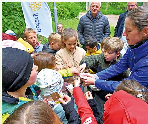
1. Aschersleber Waldwoche