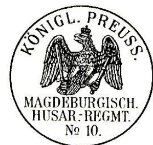
Aschersleben um 1824